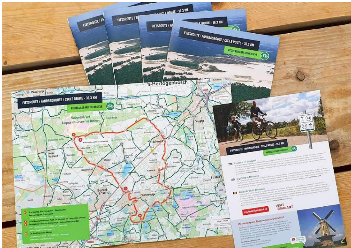
Voorbeeld kaartendienst op maat: flyer met belevingsroute van Recreatiepark Duinhoeve.