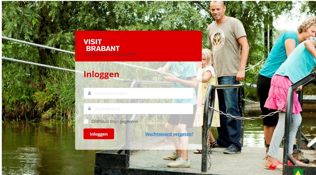
Afbeelding 1: het inlogscherm

Ga naar https://odp.visitbrabant.com/ en vul hier de inloggegevens in. Let op: wij raden je aan om tijdens dit hele proces met de Google Chrome browser te werken. Mocht je het eerder opgegeven of aangemaakte wachtwoord kwijt zijn, dan kun je gebruik maken van de knop “wachtwoord vergeten”.