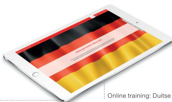
Online training: Duitse gast

Gastvrijheid zit bij Brabanders in het DNA . Toch is het belangrijk om goed te snappen wat bezoekers verwachten. Met o.a. masterclasses, online trainingen en slimme hulpmiddelen als een internationale vakantiekalender, krijg je concrete informatie om de beleving van jouw gasten eenvoudig te verbeteren .